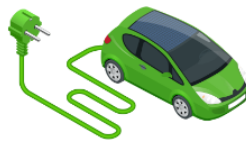
Mașini electrice / hibrid