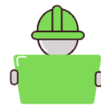
Materiale pentru placarea locuințelor

Vă așteptăm în sediile noastre pentru a profita de: